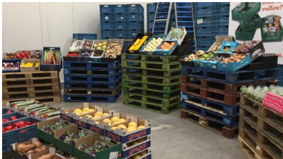
Enorme diversiteit in aanbod bij de Groente & Fruit Brigade in Poeldijk (Westland)

werden van verspilling gered en aan de voedselpakketten van onze klanten toegevoegd; gemiddeld tien ton per week. De ambitie is om meer partijen in het Westland aan te sluiten, zodat uiteindelijk alle klanten van de voedselbank verse groenten en fruit ontvangen. Klik hier voor de website met meer informatie over dit initiatief van Voedselbanken Nederland.