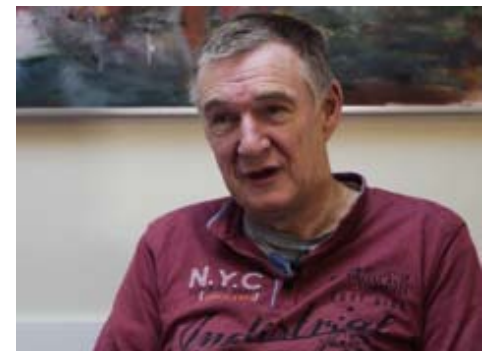
Klant vertelt openhartig over schaamte

In de vorige Vitamine berichten wij over initiatieven om schaamte te doorbreken. Voedselbank Nijmegen produceerde in dat kader een prachtig, integer filmpje . VB Den Haag experimenteert momenteel met huis-aan-huis flyering. Na het artikel over het schaamte project, meldde zich spontaan een Fonds met de vraag of ze konden helpen. We hebben een aanvraag mogen indienen! Wordt vervolgd.