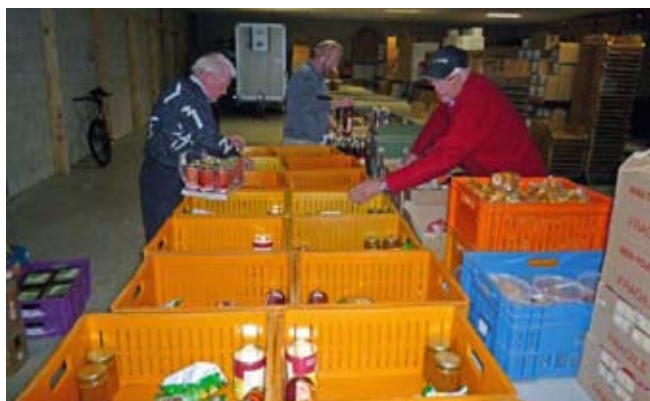
De voedselkragen worden gevuld

Voedselbanken Nederland heeft het land opgedeeld in 8 Regio's. Verdeeld over de regio's zijn er ca 135 Lokale Voedselbanken, variërend in grootte van veertig tot achthonderd cliënten. Wekelijks, in sommige gevallen om de week, worden aan ca 20.000 gezinnen (samen zo'n 50.000 mensen) voedselpakketten verstrekt. Op een klein aantal na, hebben de Lokale Voedselbanken een aansluitingsovereenkomst gesloten met de Regio. Zo zijn ze 'erkend' en mogen het officiële logo gebruiken