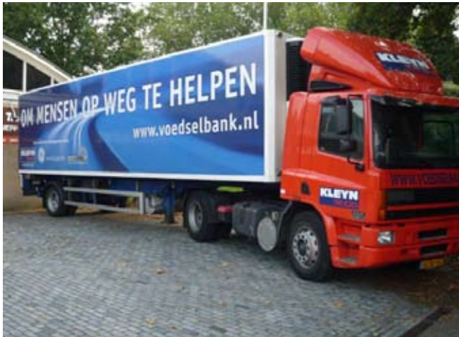
één van de vrachtauto's die wordt ingezet voor de aanvoer van aangeboden goederen

Ten behoeve van de verdeling van de beschikbare goederen over het land is goede logistiek van essentieel belang. In 2010 werden de twee vrachtwagens (trucks met oplegger) die de landelijke organisatie via een actie kreeg, beschikbaar gesteld aan de Regio's Rotterdam en Noord/Oost. Ze werden ingezet voor het ophalen van aangeboden voedsel en het transport tussen de verschillende Regio's. Zodra het voedselregistratiesysteem in de regio's is ingevoerd, zal onderzocht worden op welke wijze het logistieke proces efficiënter en effectiever kan worden ingericht.